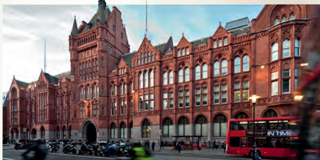
Holborn Bars – siedziba Prudential w Londynie

Według stanu na dzień wybuchu wojny w Polsce funkcjonowały 4623 polisy Prudential. Obietnice Towarzystwa Prudential w Polsce nie wygasły jednak wraz z wybuchem wojny. Pomimo tego, że firma nie mogła kontynuować normalnej działalności w powojennej komunistycznej Polsce i że wojna praktycznie zniszczyła archiwum firmy, od roku 1948 do dziś trwają poszukiwania spadkobierców posiadaczy dawnych polis i wypłaty pieniędzy. Dbając o to, by dotrzymać danego kiedyś słowa, stworzyliśmy i stale uaktualniamy listę poszukiwanych spadkobierców przedwojennych polis ( www.prudential.pl/historia ).