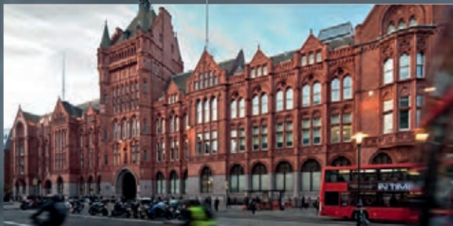
Holborn Bars – siedziba Prudential w Londynie

Według stanu na dzień wybuchu wojny w Polsce funkcjonowały 4623 polisy Prudential. Obietnice Towarzystwa Prudential w Polsce nie wygasły jednak wraz z wybuchem wojny. Pomimo tego, że firma nie mogła kontynuować normalnej działalności w powojennej komunistycznej Polsce i że wojna praktycznie zniszczyła archiwum firmy, od roku 1948 do dziś trwają poszukiwania spadkobierców posiadaczy dawnych polis i wypłaty pieniędzy. Dbając o to, by dotrzymać danego kiedyś słowa, stworzyliśmy i stale uaktualniamy listę poszukiwanych spadkobierców przedwojennych polis ( www.prudential.pl/historia ).