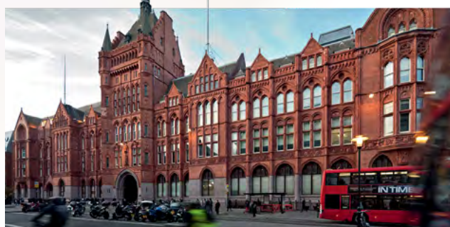
Holborn Bars – siedziba Prudential w Londynie

Według stanu na dzień wybuchu wojny w Polsce funkcjonowały 4623 polisy Prudential. Obietnice Towarzystwa Prudential w Polsce nie wygasły jednak wraz z wybuchem wojny. Pomimo tego, że firma nie mogła kontynuować normalnej działalności w powojennej komunistycznej Polsce i że wojna praktycznie zniszczyła archiwa firmy, od roku 1948 do dziś trwają poszukiwania spadkobierców posiadaczy dawnych polis i wypłaty pieniędzy. Dbając o to, by dotrzymać danego kiedyś słowa, stworzyliśmy i stale uaktualniamy listę poszukiwanych spadkobierców przedwojennych polis ( www.prudential.pl/historia ).